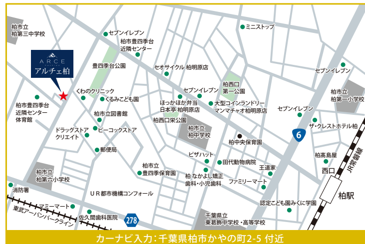
カーナビ入力: 千葉県柏市かやの町2-5 付近

TVアンテナ(電波障害)によるケーブルTV、共聴アンテナの申込みはお客様負担となります。電気供給のため、敷地内に電柱及び支線が入る場合があります。※所有権移転手続きにおいて当社指定の司法書士を利用して頂きます。※建築条件付売地とは、土地売買契約後3ヶ月以内に当社(土地の売主)と建物請負契約を締結することを条件として販売します。この期間内に建築請負契約が締結されない場合は、土地売買契約はなかったこととなり、預り金等問わず、受領済みの金額は無条件で速やかに全額をお返しします。